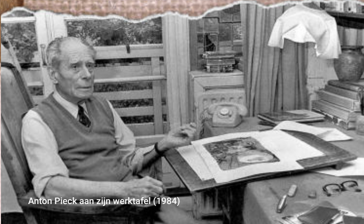
Anton Pieck aan zijn werktafel (1984)