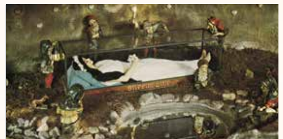
Uitvoering van Sneeuwwitje in de Efteling naar aanleiding van de ontwerptekeningen van Anton Pieck. Beide te zien in de expositie.

het officiële gedeelte de inwoners en vele toeristen die aanwezig waren in het centrum van Hatterem, met een rondgang. Met veel verve vertoonden ze zich, deelden ze flyers uit van de tentoonstelling en lieten ze van zich horen met het dwergenlied He Ho. De tentoonstelling is nog te zien tot en met 28 februari 2021.