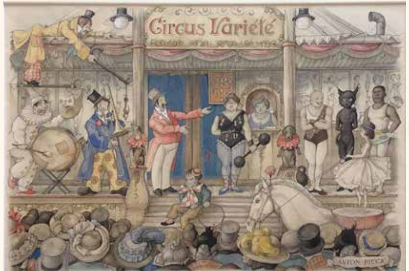
Kalenderplaat Circus Variété

Dit gehele jaar staat in het teken van de 125 e geboortedag van Anton Pieck. Twee hele verdiepingen zijn ingericht om de bezoeker mee te nemen door het werk én het leven Anton Pieck.