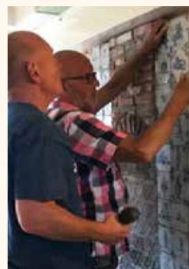
Een precies werkje

een nepschoorsteen maar ik heb het alleen gedaan zo om de tegels op te bergen. Het is wel leuk." Wij zijn zeer verheugd te kunnen mededelen dat deze schouw vanaf 2 februari een vaste plek zal krijgen in ons museum. Met grote dank aan de familie Meerburg.