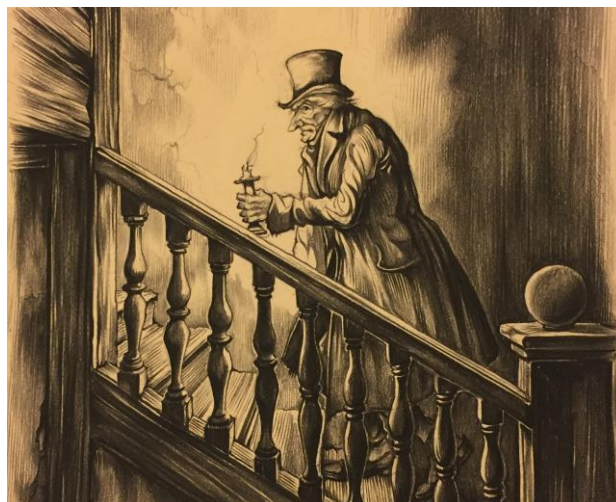
De oude Scrooge in potloodtekening