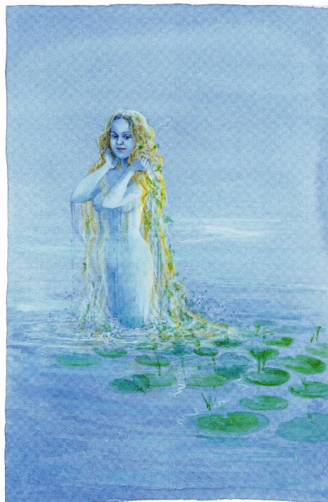
illustratie van de ondeugende nimf door Charlotte Dematons

Heel bijzonder was het om de verschillen waar te nemen.