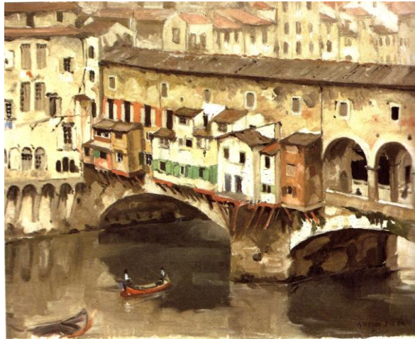
De veelzijdigheid van Anton Pieck komt ook hier weer aan de orde. Een olieverf van de wereldberoemde brug in Florence, de Ponte Vecchio.

Dit jaar zijn ook twee tijdelijke tentoonstellingen ingericht. Vanaf 6 juni tot en met 31 oktober was er een bijzondere tentoonstelling samengesteld. Deze keer stonden tekeningen van Anton Pieck centraal, gemaakt tijdens zijn reizen door veel Europese landen. Vooral in zijn jonge jaren bezocht hij vele landen waaronder België, Frankrijk, Duitsland, Oostenrijk, Zwitserland, Italië, Engeland, Ierland, de Scandinavische landen en Marokko. Van de 120 tekeningen was een groot deel nog nooit eerder geëxposeerd. Thema van de expositie was: “ Anton Pieck Onbegrensd ”.