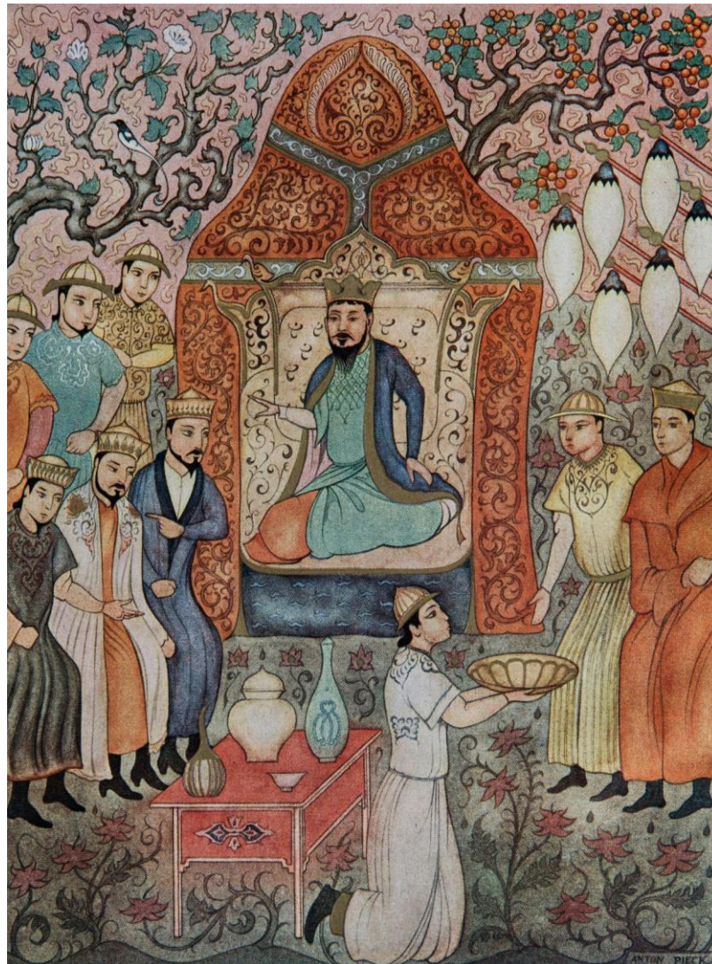
afbeelding aankoop in 2016 , unieke boekillustratie "Het erfgoed van een groot Mongool"