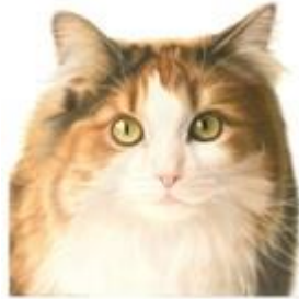
één van Franciens katten

Dit jaar zijn ook weer twee tijdelijke tentoonstellingen ingericht. Tot en met april 2016 was de tentoonstelling van het werk van Francien van Westering te zien onder de naam: “Miauw!” 25 jaar Franciens katten . In het jaarverslag van 2015 is over de tentoonstelling het nodige verhaald. Het was een overzichtstentoonstelling ter ere van het 25 jarig jubileum van Francien van de Westering als kattentekenaars. Zij gaf in 2016 ook enkele workshops, die druk werden bezocht.